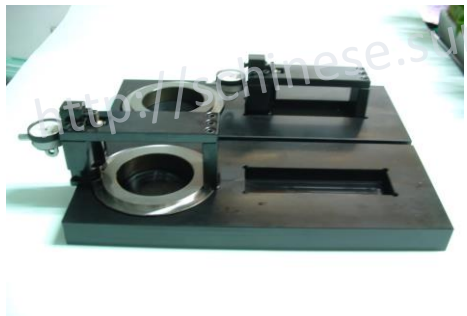
端面短距垂直度比測量具