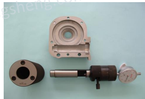
特殊內孔溝距量具