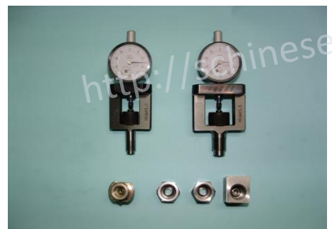
特殊牙孔深度.內錐面同軸度量具