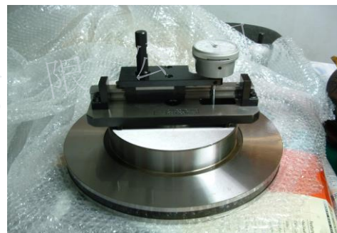
煞車盤平面度量具