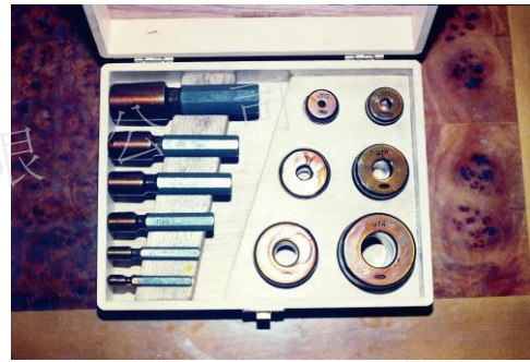
ER. JT. MT. OZ. B...各式斜度規