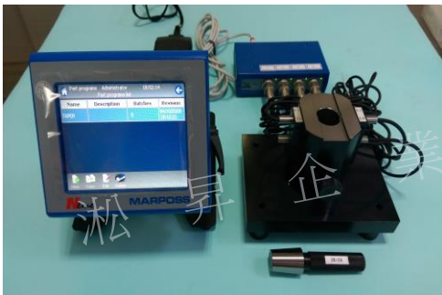
電子式各式斜度比測量具