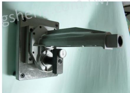
變速箱孔位附表檢具