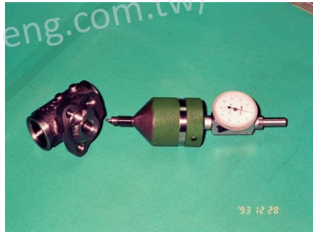
煞車分邦同心度檢具