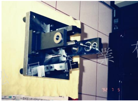
煞車總邦孔位檢具