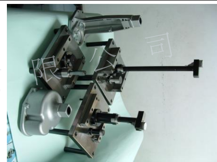
變速箱同心度附表檢具