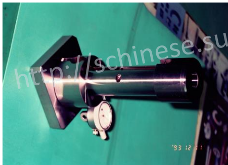
CALIPER 油封溝同心度檢具