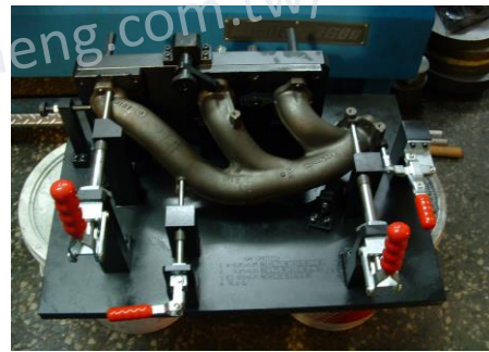
排氣管結合面孔位檢具