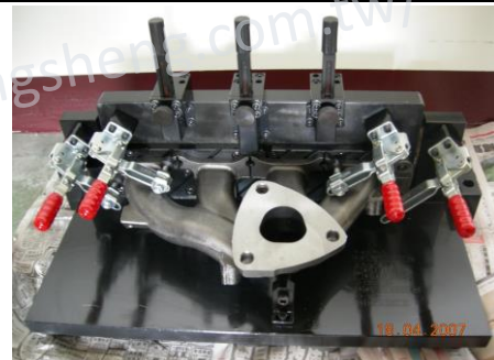
排氣管溝位置檢具