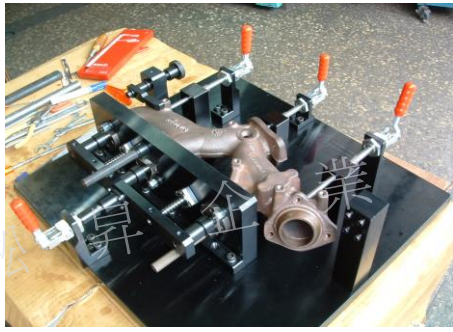
排氣管底面基準孔檢具