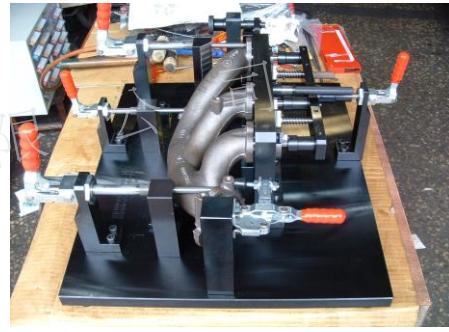
排氣管底面基準孔檢具