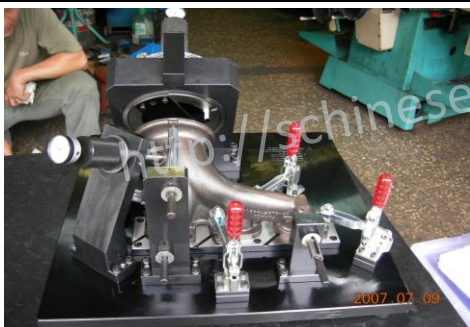
排氣管法蘭面及孔位檢具